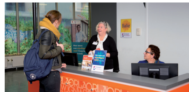
Medewerkers van het Servicepunt Vrijwilligers helpen u graag verder bij de balie in de bibliotheek.

Stadsbibliotheek Centrum, Medialounge, Waalstraat 100, Vlaardingen Openingstijden: zie www.vlaardingen.nl/vrijwilligers