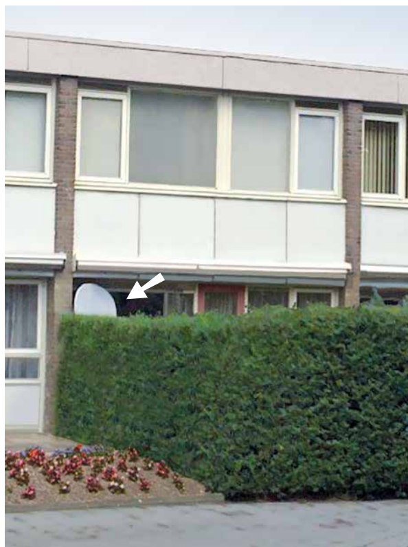
Schotelantenne goed geplaatst