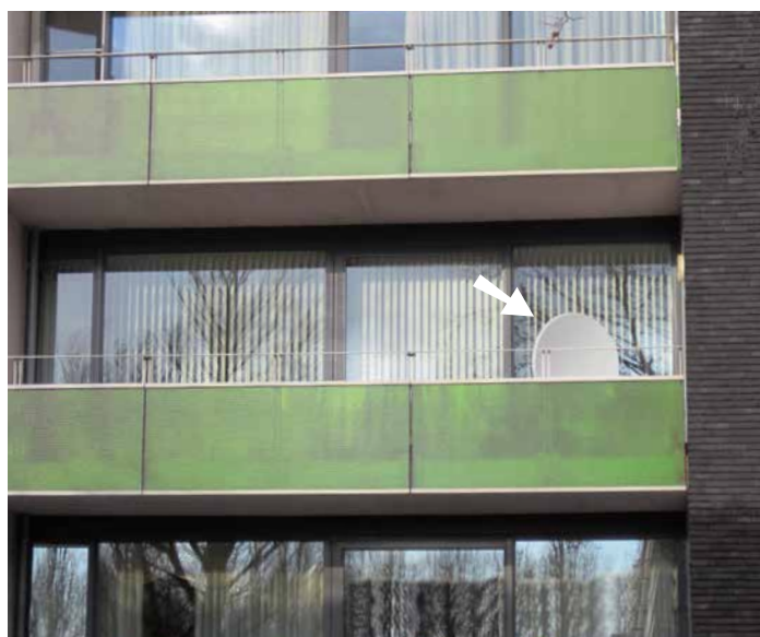
Schotelantenne goed geplaatst